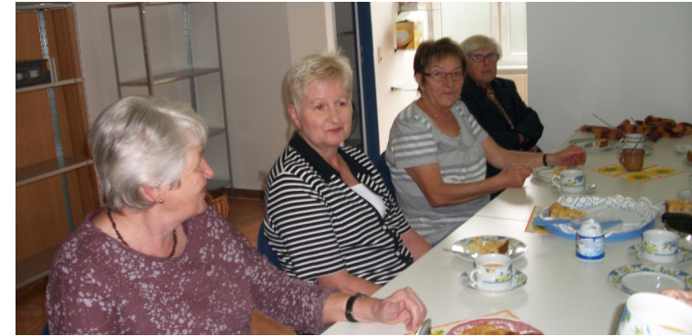
Treffen der Handarbeitsgruppe: Jeden 2. Dienstag von 14.00 bis 17.00 Uhr

Die Handarbeitsgruppe - gute Freundinnen treffen sich!